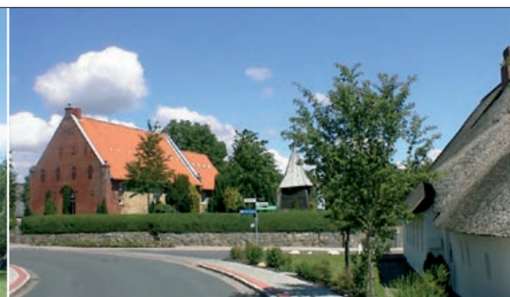
Historischer Dorfkern mit Kirche in Bargum