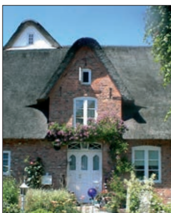
Reetdachhaus in Bargum