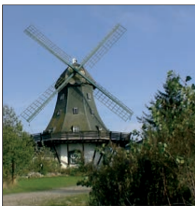
«Westermöhl» in Langenhorn