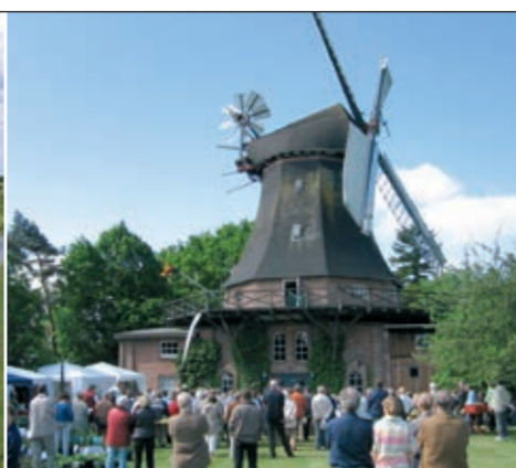
«Aeolus» in Bargum