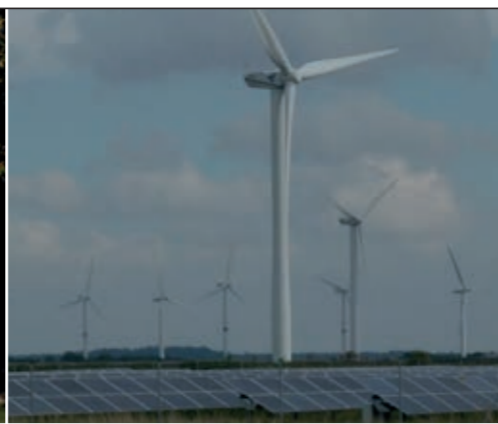
Windkraft und Fotovoltaik