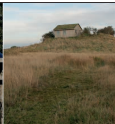
Inföhütte auf dem 'Richi-Hügel'