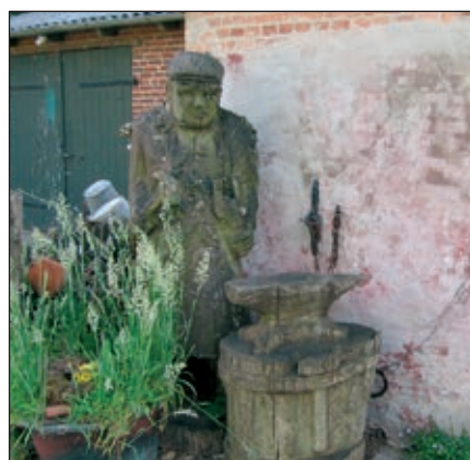
Alte Schmiede Lütjenholm